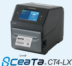
シータ SCeaTa ® CT4-LX