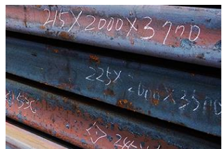
鉄鋼・非鉄金属：手書き・刻印

学習機能のあるAI OCRでは、従来読み取りが難しかった手書きなどの文字情報を読み取ることができます。