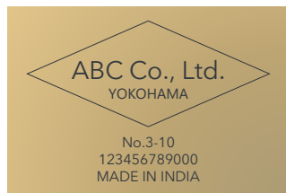
航空貨物：ケースマーク