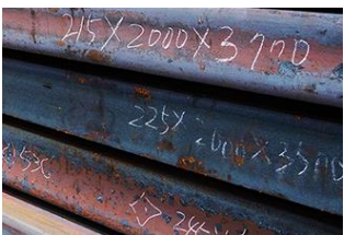
鉄鋼・非鉄金属：手書き・刻印

学習機能のあるAI OCRでは、従来読み取りが難しかった手書きなどの文字情報を読み取ることができます。