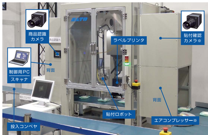
【フロチルラベラー® Pro 外観】

コンベヤに投入した食品パッケージの位置と向きをカメラで読み取り、指定した貼付位置を自動的に検出します。印字発行したラベルをパラレルリンクロボットが高速かつ正しい位置へ貼り付けます。