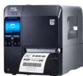
スキヤントロニクス CL4NX-J Plus