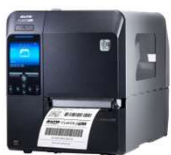
スキャントロニクス CL4NX-J Plus