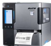
スキャントロニクス CL4-SXR